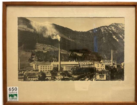
Das Werksgelände Mitte des 20. Jahrhunderts

Als Folge einiger Eigentümerwechsel und eines Großbrandes im Jahr 1979 wurde das Werk modernisiert und ausgebaut. Die Produktion erfuhr genau wie die Vertriebswege eine Umstrukturierung. Das Unternehmen entwickelte sich von einem Lieferanten für Händler und Endverbraucher zu einem Verpackungsmittelfachhändler und Weiterverarbeiter.