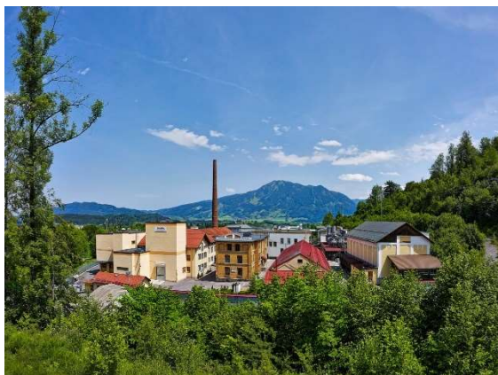
Blick auf das monta-Gelände im Jahr 2017

In Folge des Wiederaufbaus nach einem Großbrand 2015, der das Gebäude und die Produktionsanlagen der Klebebandschneiderei am Immenstädter Standort zerstört hatte, wurde 2016 die neue, hochmoderne Klebebandschneiderei eingeweiht.